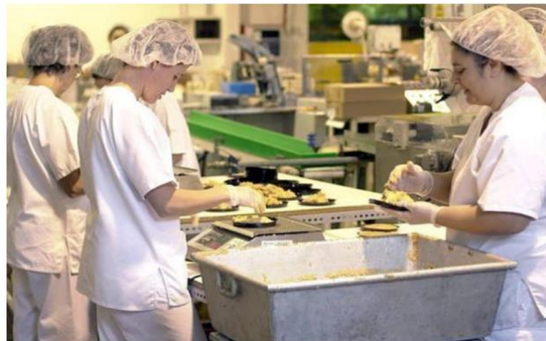
Alumnas de un grado de Formación Profesional trabajando en su jornada lectiva.

Estos profesionales apuestan por la cualificación permanente y la FP Básica o Media para luchar contra este problema social