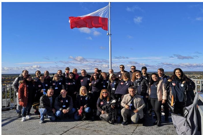
Fotografía 3: Grupo en la Fortaleza Teutónica de Czluchow

La realización de talleres de búsqueda activa de empleo, entre otros, forman también parte de las funciones de este Centro.