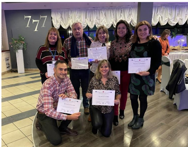
Fotografía 5: Grupo posando con los certificados de asistencia

potenciando la adquisición de nuevas estrategias profesionales que benefician el día a día de nuestro complejo e imprescindible trabajo.