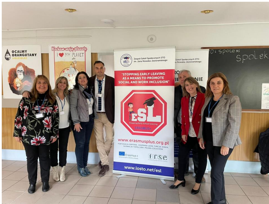
Fotografía 1: Fotografía de grupo de los participantes de USIE en la actividad formativa.