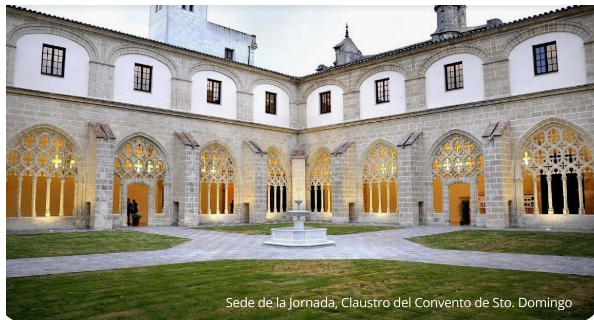
Sede de la Jornada, Claustro del Convento de Sto. Domingo

Junto a esto, las Jornadas ofrecen una amplia, extensa y variada oferta de actividades culturales para el encuentro presencial y la convivencia del colectivo, lo que contribuirá al intercambio de experiencias y prácticas, tanto en lo profesional como en lo humano y personal, que es tan necesario e importante como lo primero.