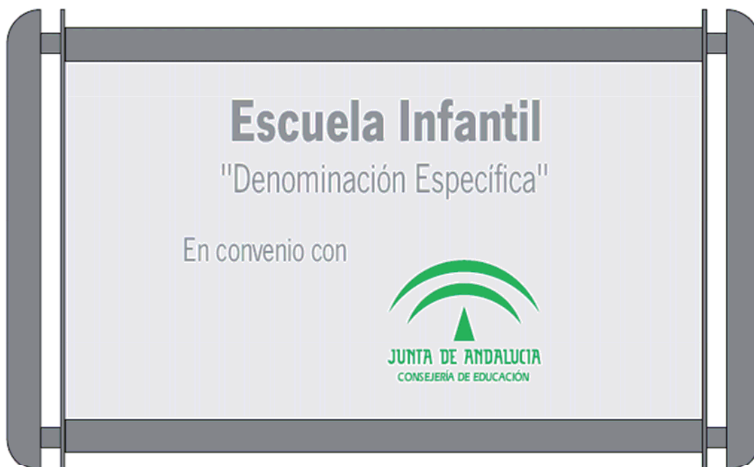
PLACA A PARED SP